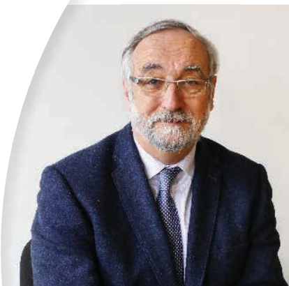
Jean SERRET Président de la Communauté de communes du Val de Drôme en Biovallée - Maire de Eurre

La culture cultive l'esprit. Avec d'un côté, celle des connaissances et des savoirs. Et de l'autre, celle des patrimoines et des arts. C'est une culture qui ouvre sur mille histoires, mille découvertes, mille réflexions. C'est celle qui contribue à l'éducation, à la curiosité et à une forme d'épanouissement personnel. Et c'est celle à laquelle la Communauté de communes participe aussi. En soutenant les acteurs du spectacle vivant, en co-produisant des programmations, ou encore en aidant les animations et manifestations, l'objectif est de faciliter l'accès de tous à une offre culturelle et artistique variée.