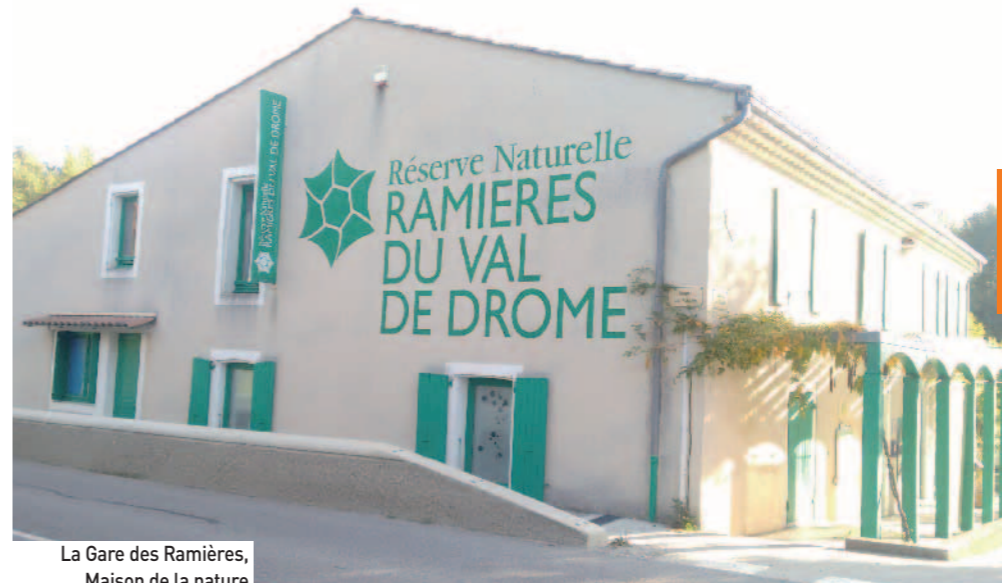
La Gare des Ramières, Maison de la nature