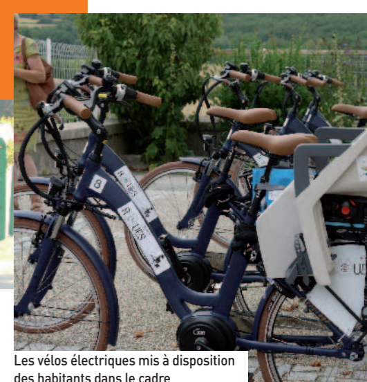
Les vélos électriques mis à disposition des habitants dans le cadre de l'expérience 2 roues.

Connectez-vous valleedeladrome-tourisme.com