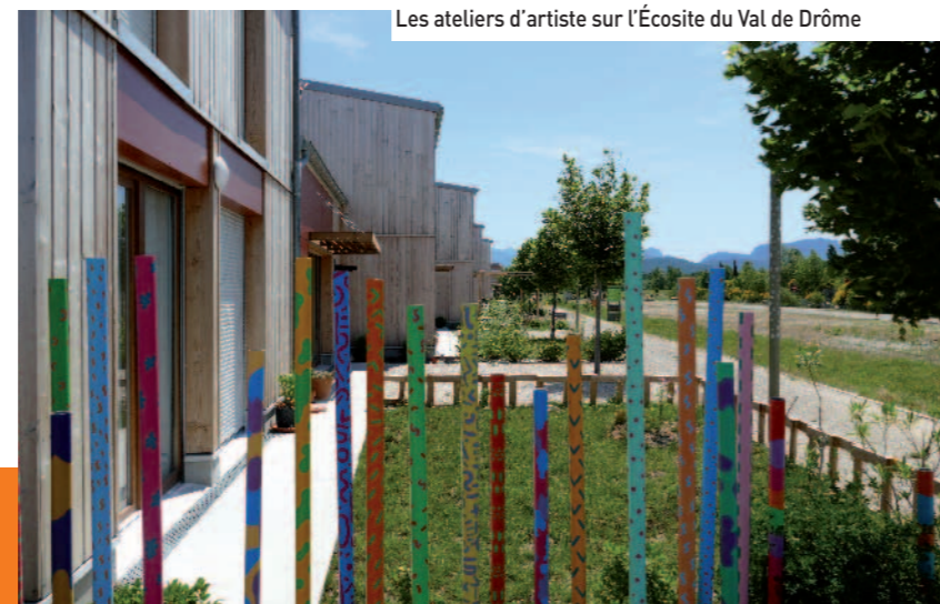
Les ateliers d'artiste sur l'Écosite du Val de Drôme

Neuf villas d'artistes et d'artisans d'art constituent aujourd'hui la Promenade des Arts, à Eurre.