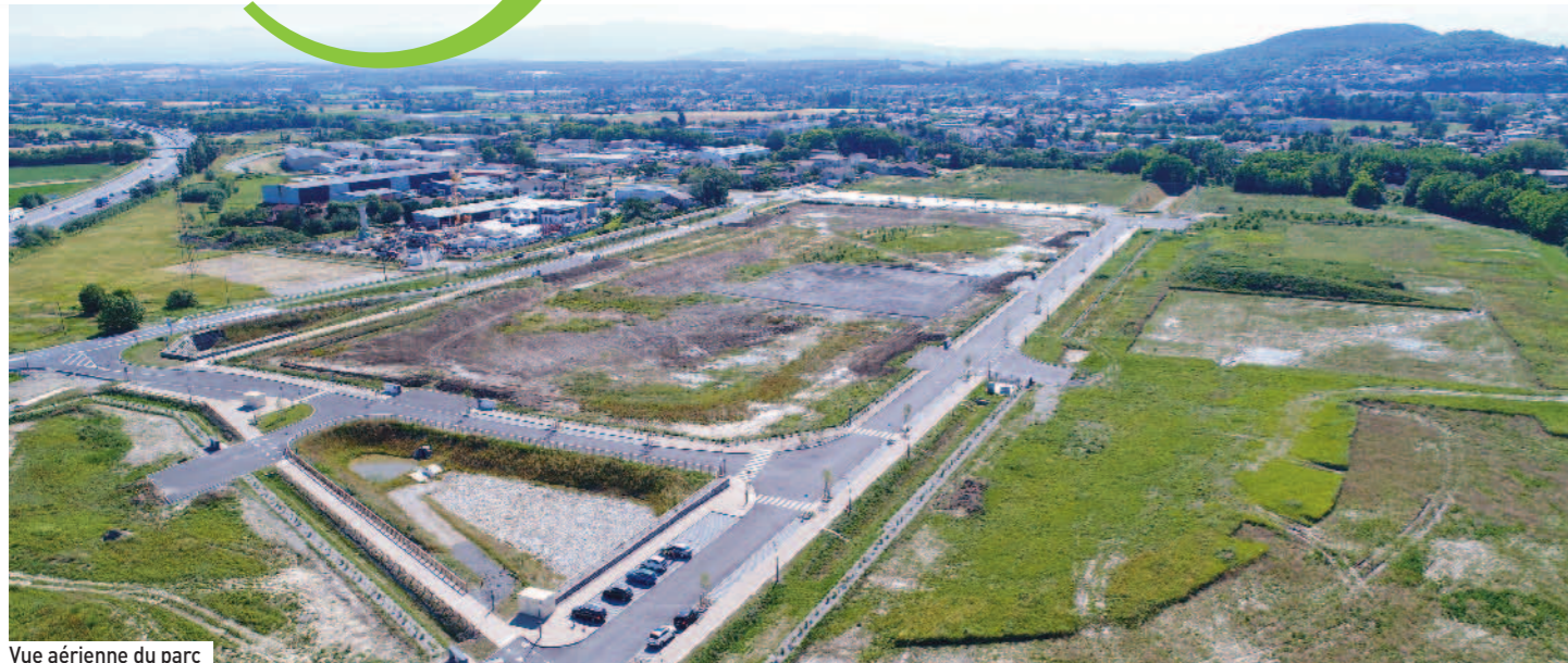
Vue aérienne du parc