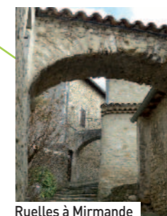
Ruelles à Mirmande

Mirmande : les mardis 9 et 23 juillet de 17h à 18h30, mercredi 7 août de 10h30 à 12h, mardi 20 août de 17h à 18h30.