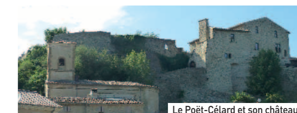
Le Poët-Célard et son château

Et elle conclut : « exercer ce métier est un vrai plaisir, il faut être passionné pour être guide ».