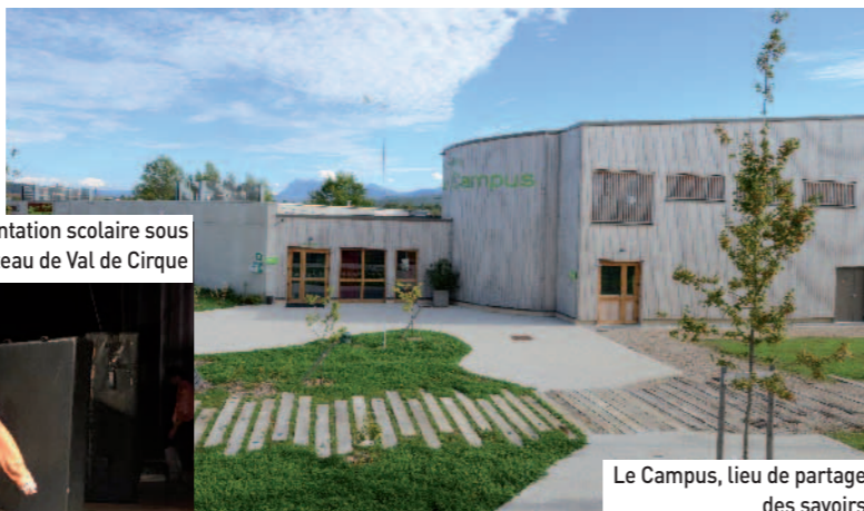
Le Campus, lieu de partage des savoirs