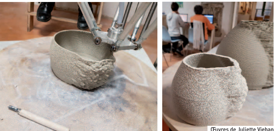
Œuvres de Juliette Vieban

Une vingtaine de professionnels : designers, artistes, potiers, céramistes, bijoutiers... se forment et réalisent des pièces imprimées sur une imprimante 3D céramique. Les résultats de ce projet inédit et unique en Europe seront présentés lors d'une exposition à la Poterie de Cliousclat à l'automne prochain.