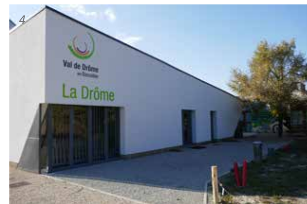
1. Site de projet