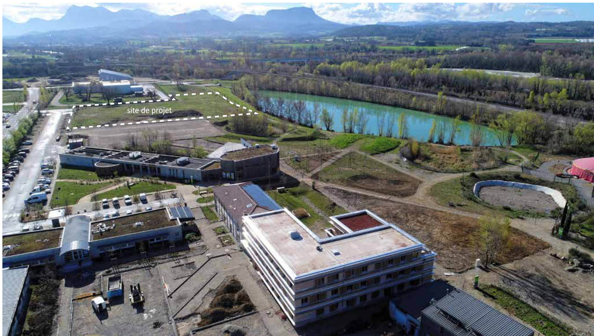
↑ Vue aérienne du site réservé pour le projet